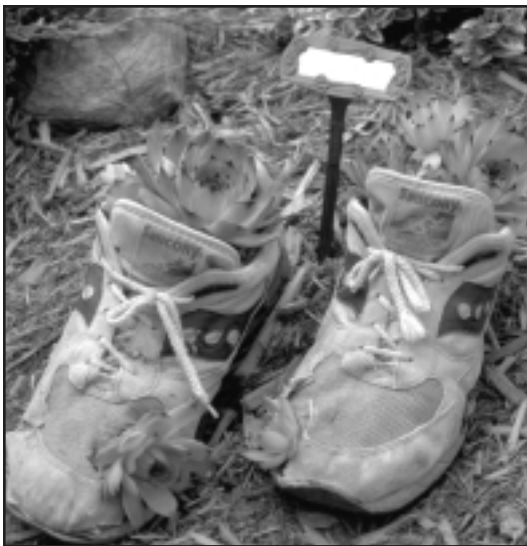
Westvale Public School